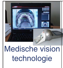
Medische vision technologie